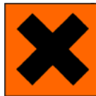
Xn, Sundheds- skadelig